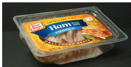
Soluciones para la decoración de envases termoformados

Etiqueta Libro con ideas de recetas para agregar valor al producto